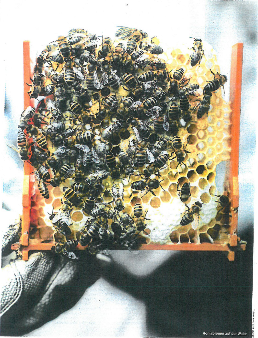
Honigbienen auf der Wabe

So steuern Honigbienen am liebsten Blüten auf der Sonnenseite der Pflanzen